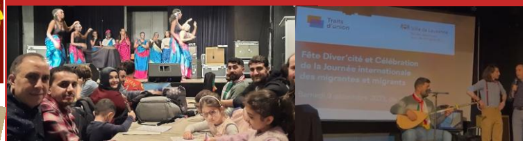
Participation active à la Fête de la Diversité de Lausanne

Intervention au Forum des Nations Unies sur les questions relatives aux minorités (2025)