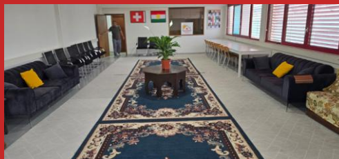
Nos sections en Suisse

Mission principale : Promouvoir le développement culturel et éducatif de la communauté kurde, favoriser une intégration harmonieuse des personnes immigrées dans la société suisse tout en préservant leur identité culturelle, leur langue et leur patrimoine pour les générations futures.