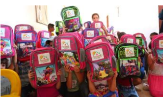
Distribution de cartables scolaires aux enfants du Rojava