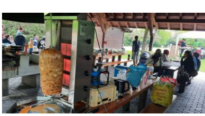
Kermesse (bazars caritatifs)