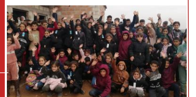
Distribution de manteaux aux enfants du Rojava...