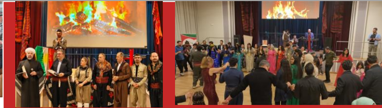
Célébration de Newroz organisée par Mala Kurdan Argovie