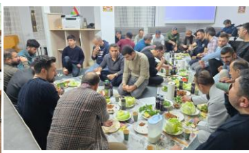
Participation au Festival culturel d'Argovie