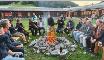
Camps en châlet d'été et d'hiver en Suisse