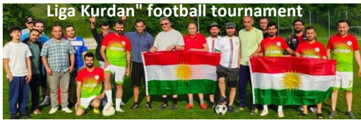
Liga Kurdan" football tournament