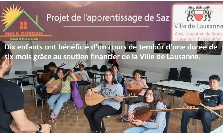
Projet de l'apprentissage de Saz

À l'occasion du centenaire du Traité de Lausanne, l'Association MALA KURDAN a réalisé, avec le soutien de la Ville de Lausanne, le projet intitulé « 100 œuvres kurdes remarquables en 100 ans ». https://100berhemenkurdi.com